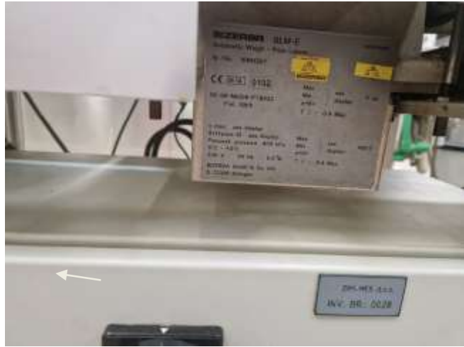
Sl./in.br. 142-Bizerba GLM-E