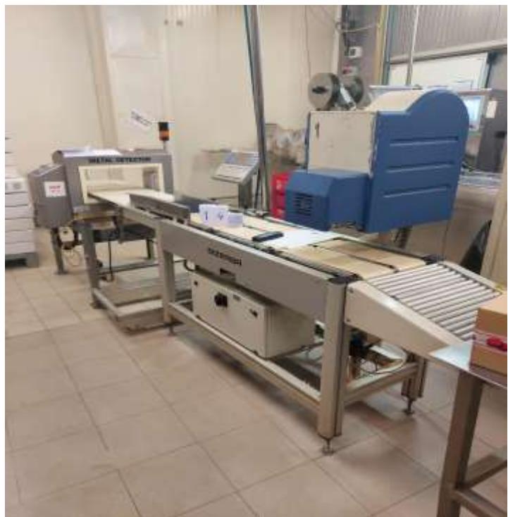
Sl./in.br. 142- Bizerba