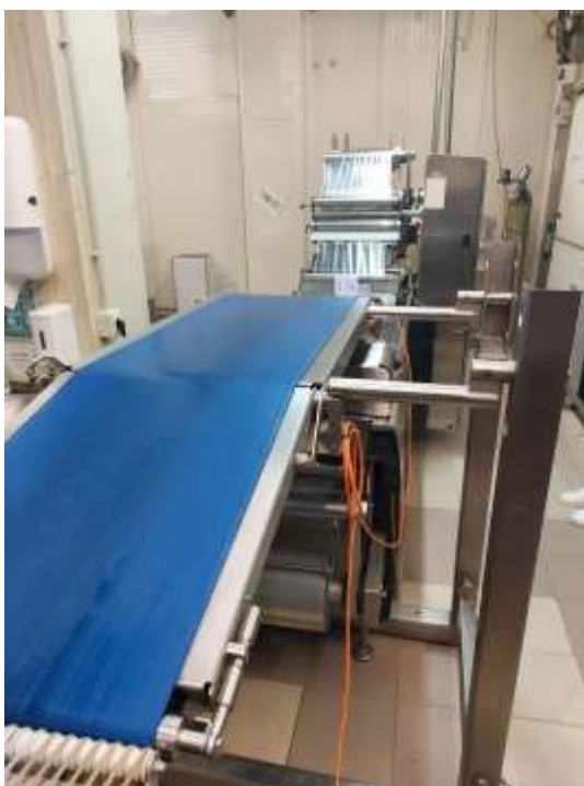
Sl./in.br. 142 Multivac R-105