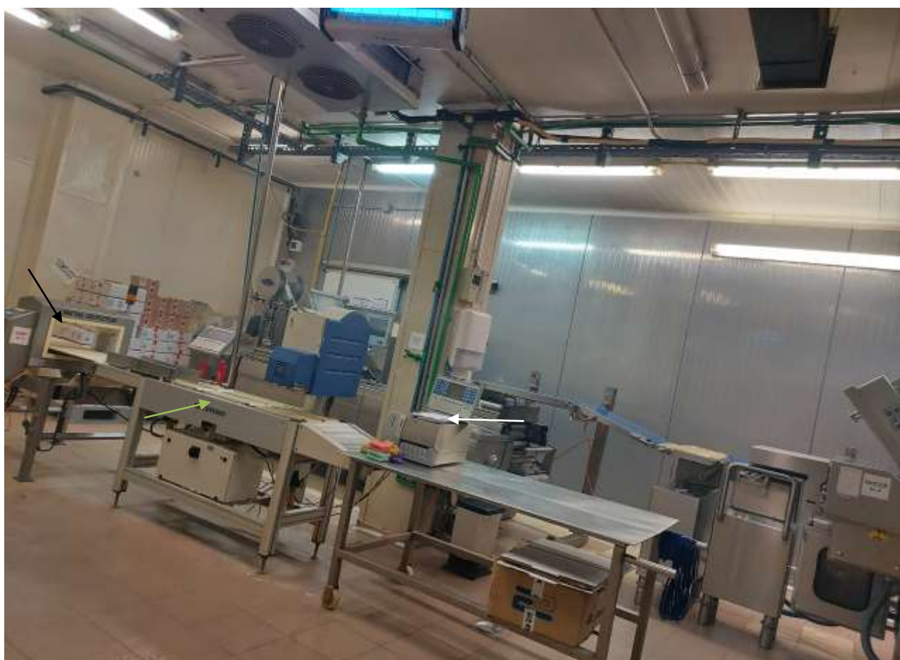
Sl./in.br. 142 -Bizerba-(strelica crna MD-metal detektor, maslinasta br.2.GLM-E, strelica bijela br. 3. GLP-W)