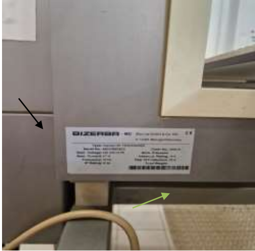
Sl./in.br. 142- Bizerba – MD metal detektor