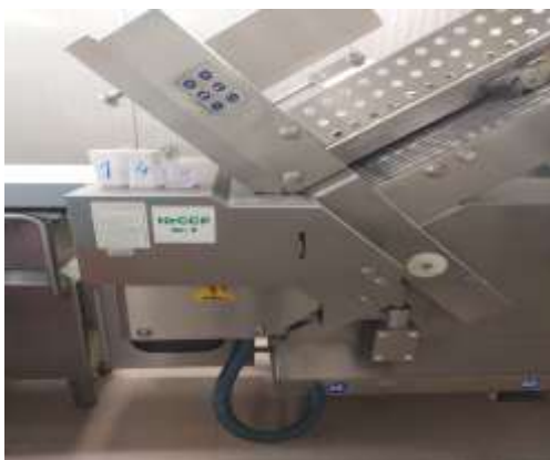
Sl./in.br. 142- Weber 305-433