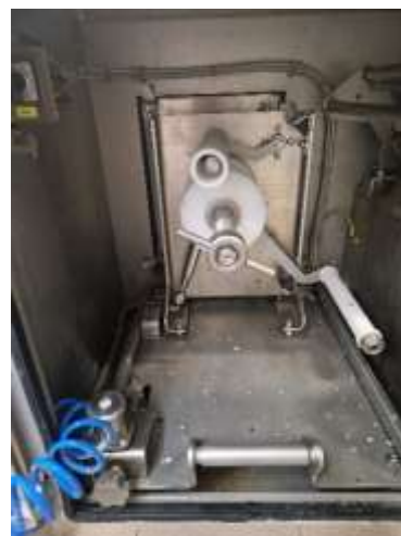
Sl./in.br. 142- Weber-oštrač noža KSG 47,-stroj za umetanje listića