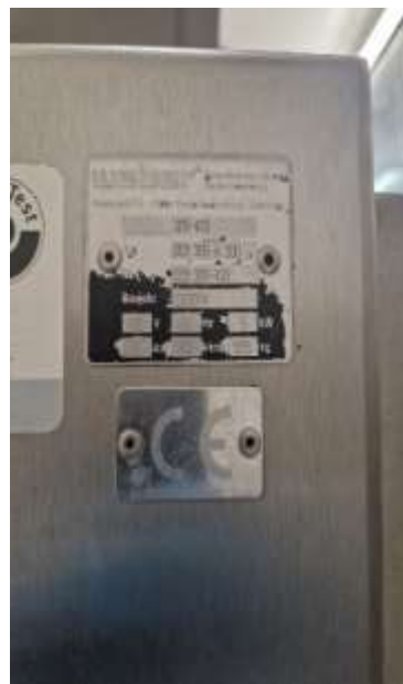
Sl./in.br. 142- Weber 305-433: